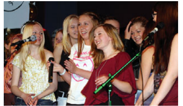
Glädje var en av många känslor som präglade årets kabaré.

BONDFANTAST. Agentexpert dyker upp i tv:s Fantasterna